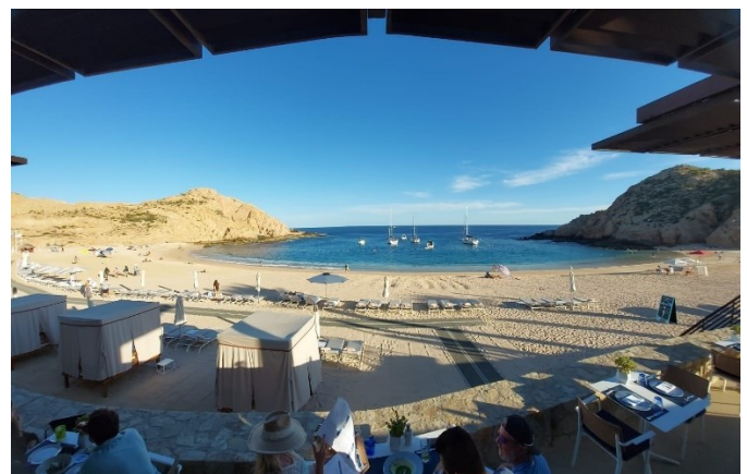
Playa Santa María, Los Cabos, Baja California Sur.

El proceso para obtener el distintivo Blue Flag sigue un estricto protocolo de verificación, el cual inicia con una solicitud efectuada a FEE México por parte de los solicitantes del distintivo. Posteriormente FEE México tiene la obligación de verificar la información técnica proporcionada por los solicitantes y elaborar un expediente de validación en donde se dictaminan en su caso el cumplimiento de los criterios, efectuar recomendaciones o rechazar la solicitud por improcedentes.