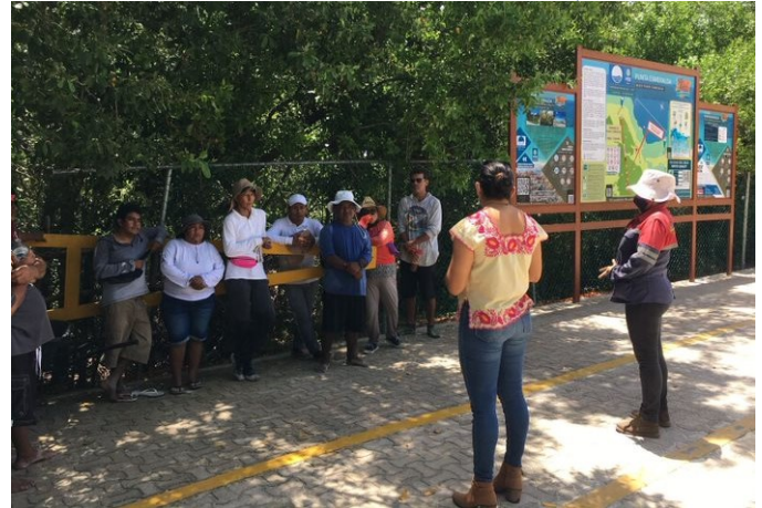
Punta Esmeralda, Solidaridad, Quintana Roo.

Es indispensable elaborar un Código de Conducta para los usuarios de la playa, el cual deberá hacer referencia a las actividades que se pueden realizar, las zonas establecidas para ello y la forma en que los visitantes deben comportarse. El código debe estar visible en varios puntos en la playa y estar a disposición de quien lo solicite en el centro de atención Blue Flag . Sus elementos deberán ser representados en forma de señales, pictogramas y/o información escrita. Se recomienda, siempre que sea posible, el uso de símbolos utilizados a nivel nacional e internacional.