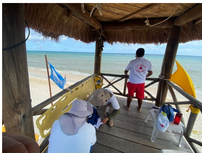
Guardavidas, Iberostar, Quintana Roo

El equipo de primeros auxilios debe estar debidamente resguardado por el personal de socorro y ubicarse en el lugar de atención de emergencias.