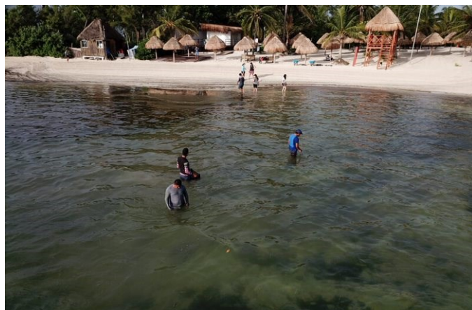
Playa Las Perlas, Cancún, Quintana Roo.

Las algas marinas y demás restos de vegetación son depositados de forma natural por las mareas y las olas en la arena de algunas playas. Se trata de algo inevitable y que debe ser aceptado, en tanto no se convierta en un claro perjuicio para los usuarios de la playa. Ello significa, en la práctica, que debe evitarse que se acumulen hasta un punto en que puedan constituir un peligro o resultar insalubres para el público. Sólo si llega a ser totalmente necesario retirar las algas o cualquier otra vegetación marina, deberá realizarse de forma “amistosa” con el medio ambiente. En la medida de lo posible se consultará a especialistas en la materia sobre la gestión de estos elementos naturales.