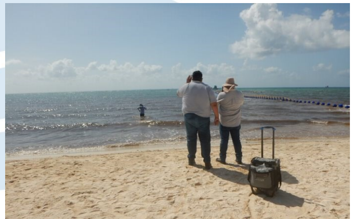
Playa Xcalacoco, Solidaridad, Quintana Roo.

Muestras para parámetros microbiológicos y fisicoquímicos deben ser tomadas. Para efectos de la realización de muestreos y del procedimiento Blue Flag México para el análisis de calidad de agua se considerarán los laboratorios acreditados por la Entidad Mexicana de Acreditación (ema) , organización sin fines de lucro reconocida internacionalmente por el Foro Internacional de Acreditación (IAF) y la Cooperación Internacional de Acreditación de Laboratorios (ILAC) y los reconocidos por COFEPRIS.