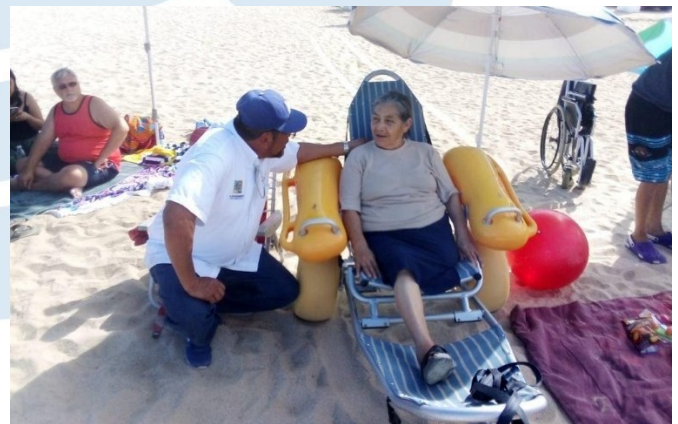
Playa El Chileno, Los Cabos, Baja California Sur.