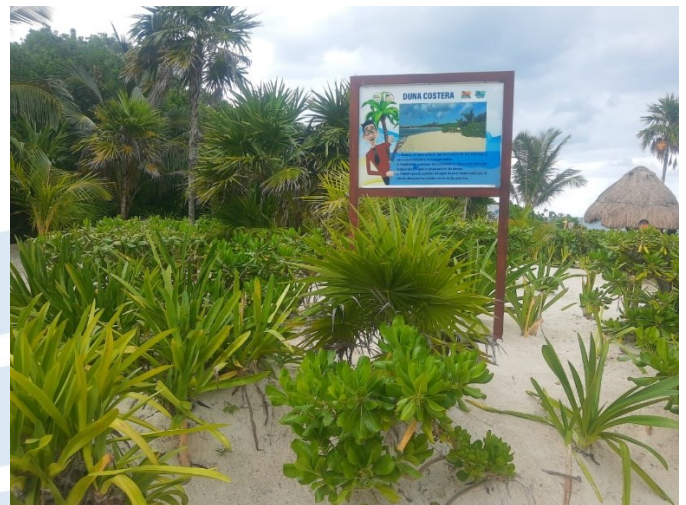
Playa 88, Solidaridad, Quintana Roo.

salidas, torres de vigilancia y salvamento o las áreas de estacionamiento.