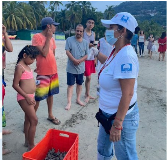
Playa El Palmar, Zihuatanejo de Azueta, Guerrero.

No existe un límite máximo o mínimo de extensión para poder inscribir una playa al programa, siempre y cuando se tenga jurídica y físicamente la posibilidad de identificar claramente el polígono que se encuentra bajo manejo, resguardo, monitoreo y muestreo de calidad de agua.