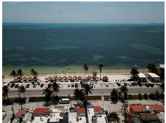
Playa Del Chileno, Cancún, Quintana Roo.

Se recomienda que el municipio solicitante disponga de un plan de gestión del tráfico, cuyo objetivo sea reducir el volumen de éste en las playas y la disminución del impacto de este en el desarrollo y ordenamiento del territorio, así como, la contaminación del aire en la zona litoral. En algunos destinos de playa ya se cuenta con autobuses que usan combustibles naturales, por lo que se recomienda habilitar una parada en el acceso de la playa. Para promover el uso de la bicicleta se recomienda incorporar zonas de resguardo en los estacionamientos y establecer un centro de renta. Se recomienda también incorporar en el panel de información contenido sobre las distintas formas de transporte más sostenible disponibles.