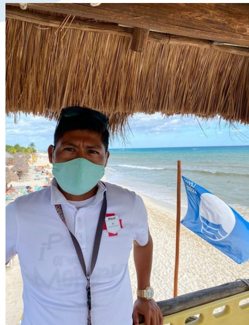
Guardavidas, Iberostar, Quintana Roo