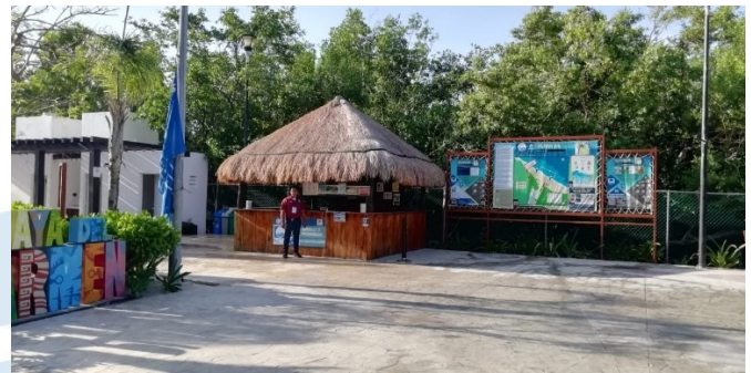
Playa 88, Solidaridad, Quintana Roo.

Para las playas que busquen obtener nuevamente el distintivo, las actividades que se planifiquen para la próxima temporada Blue Flag deben ser incluidas en el formato de aplicación, así como la información sobre las actividades que se llevaron a cabo durante la temporada anterior.