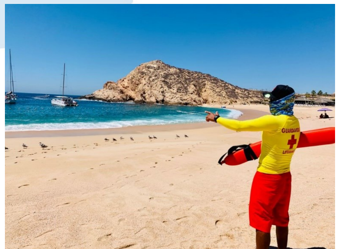
Playa Santa María, Los Cabos, Baja California Sur.

Una playa Blue Flag debe ser fácilmente accesible para todas las personas, en especial para personas con discapacidad, por lo que se debe contar con accesos fáciles, seguros y adecuados a la normatividad aplicable.