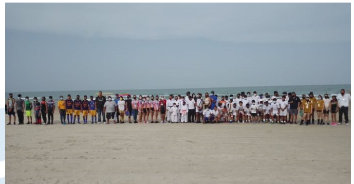
Playa Miramar, Ciudad Madero, Tamaulipas.

Es indispensable elaborar un Código de Conducta para los usuarios de la playa, el cual deberá hacer referencia a las actividades que se pueden realizar, las zonas establecidas para ello y la forma en que los visitantes deben comportarse. El código debe estar visible en varios puntos en la playa y estar a disposición de quien lo solicite en el centro de atención Blue Flag . Sus elementos deberán ser representados en forma de señales, pictogramas y/o información escrita. Se recomienda, siempre que sea posible, el uso de símbolos utilizados a nivel nacional e internacional.