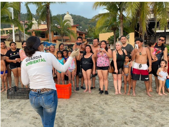
Playa La Ropa, Zihuatanejo de Azueta, Guerrero.

La playa elegible debe ser accesible en cualquier momento para la realización de visitas de verificación y monitoreo por parte de personal de FEE México y de inspecciones de reconocimiento por miembros de la FEE, Jurado Nacional y Coordinación Técnica.