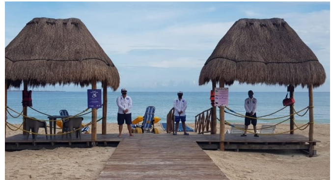
Playa Malecón Tradicional, Progreso, Yucatán.