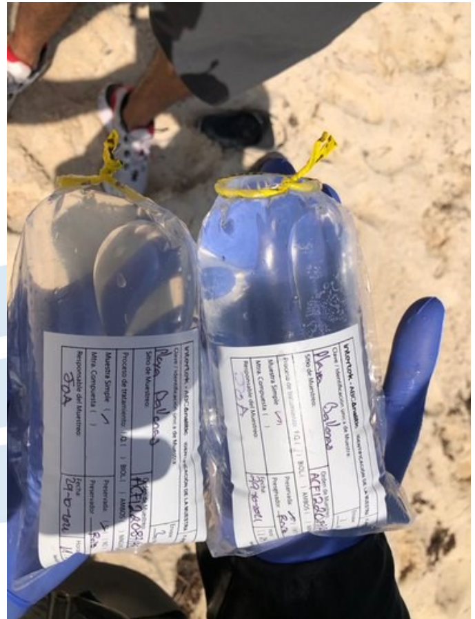
Muestras de calidad de agua.

especificada en el calendario de muestreo a menos que haya circunstancias excepcionales para cumplir esto. En tal caso el Jurado Nacional debe presentar la playa como un caso de dispensa al Jurado Internacional. Los resultados de la calidad del agua deben ser dados a FEE México tan pronto como estén disponibles, pero no más de un mes después de que la muestra haya sido tomada.