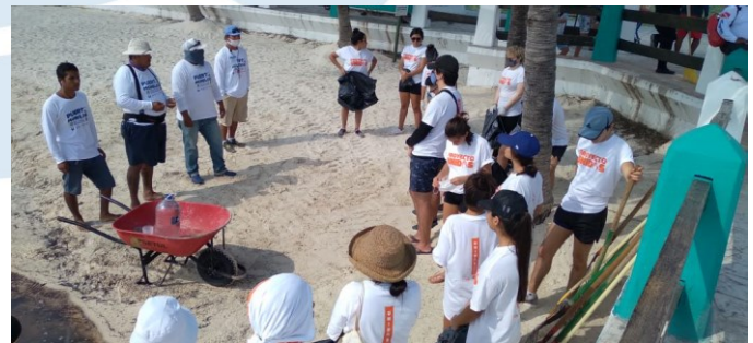
Playa Ventana al Mar, Puerto Morelos, Quintana Roo.

El código de conducta debe incluir recomendaciones y normas acerca de la prohibición de animales domésticos o de vehículos a motor en la arena; la zonificación de la playa (según los usos permitidos); el uso de ceniceros; la regulación de la zona de acampar y del uso del fuego; etc.