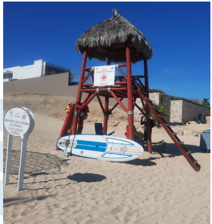
Playa El Chileno, Los Cabos, Baja California Sur.

De igual manera, FEE México podrá solicitar al Jurado Nacional e Internacional el retiro temporal o permanente del distintivo cuando derivado del proceso de verificación se establezca que los operadores o autoridades locales de la playa son responsables de transgredir la normatividad ambiental nacional, o bien, actúen en desacuerdo con los objetivos y el espíritu del Programa Blue Flag.