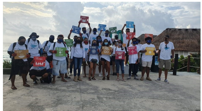
Playa Delfines, Cancún, Quintana Roo.

También debe incluir información sobre seguridad, tal como: horarios de los socorristas y delimitación de las zonas que vigilan o patrullan; horarios del servicio de primeros auxilios y explicación del sistema de banderas utilizado sobre el estado del mar. Por último, teléfonos de emergencia de la policía, urgencias médicas o de otro tipo, así como detalles para el contacto con los servicios de emergencia, en caso de emergencia por vertido de hidrocarburos, productos químicos tóxicos u otros motivos.