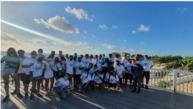
Comité de Gestión Ambiental.

Cuando en un Municipio exista más de una playa Blue Flag será un único comité de gestión el responsable para todas las playas Blue Flag. Para los efectos de la implementación del programa Blue Flag México se tomarán como válidos los Comités del Programa Playas Limpias que se encuentren previamente constituidos en cada Municipio, siempre y cuando atiendan a la integración del comité de gestión de playa antes mencionado.